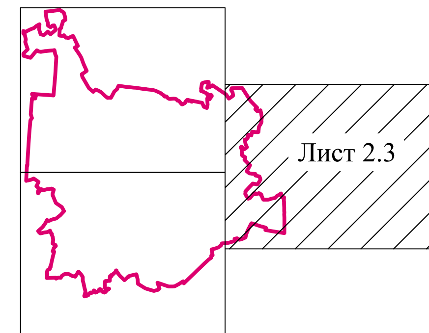
Схема раскладки листов